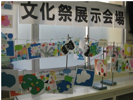
3年生活福祉選択者作品