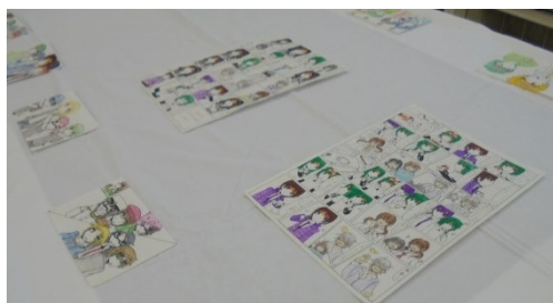
アニメコミック部