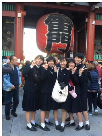
【デイズニー特別講座】