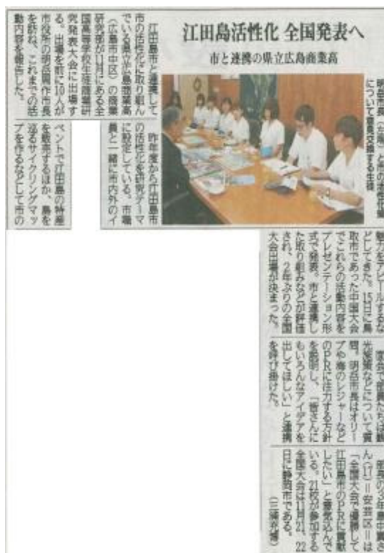
9月25日付けの中国新聞にも掲載

『第26回 全国高等学校生徒商業研究発表大会』 平成30年11月21日（水）～22日（木） 静岡市民文化会館